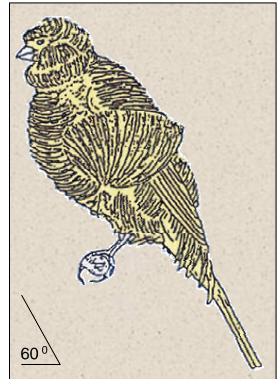
Ring / Bague Ø 3,0 mm